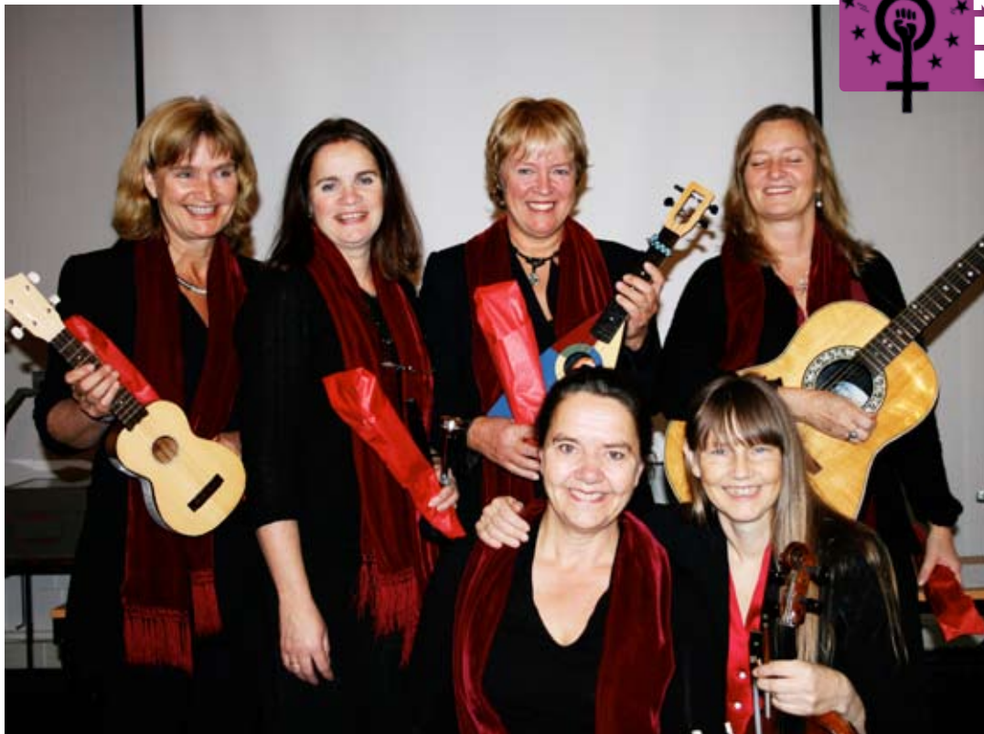
Kvinnegruppen Jadda Jadda opptredte på fjorårets konferanse