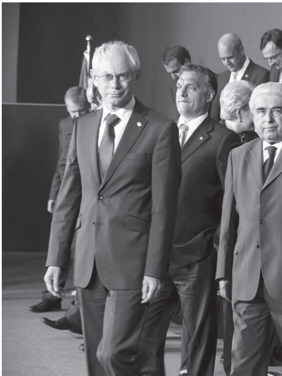
En dag på EU-toppmøtet: Statslederne er samlet i Brussel på møte i Det europeiske råd juni 2011.