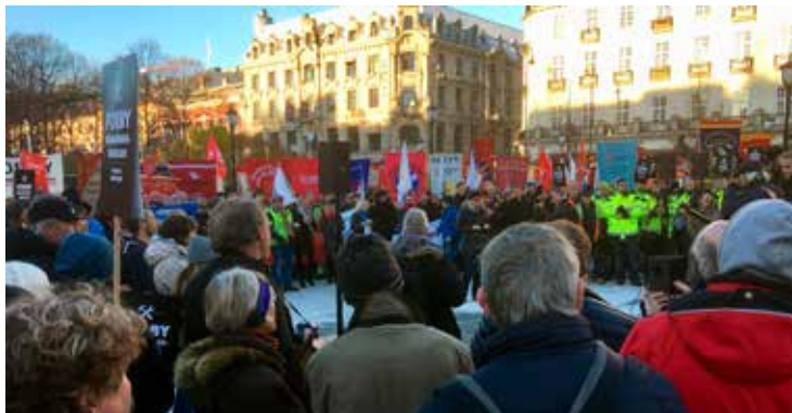
Streik mot bemanningsbransjen i november 2017. EØS og vikarbyrådirektivet var viktige tema.