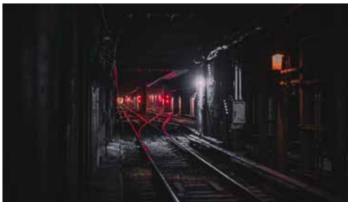
Hurdalsplattformen til Ap/Sp-regjeringa lover unntak fra deler av EUs fjerde jernbanepakke.