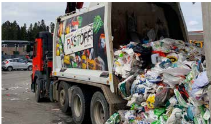
Renovasjon er en av mange sektorer som er berørt av EØS-tilsynet ESAs sak om offentlige tjenester.

Solberg-regjeringen sendte svar i mai 2021. 2 Her avvises det at velferdstjenestene barnehage, kulturskole, SFO og eldreomsorg omfattes av EUs statsstøtteregler. Videre ønsker man ikke å innføre generelle tiltak om utskilling av virksomhet til egne selskaper eller generelle regler om skatteplikt.