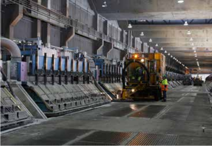
Ovnshallen ved Alcoas smelteverk i Mosjøen.

satsing på hydrogen krever svært mye strøm. Strømprisen truer hele omleggingen av landet vårt.