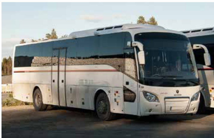
Rute- og turbusser er en viktig del av transportsystemet i det langstrakte Norge.

som kan påberope seg at de driver midlertidig på evigvarende basis. «Innføring av nasjonale tiltak vil (difor) ikkje vere i samsvar med EØS-avtalen», svarte samferdselsminister Jon Georg Dale (Frp) da han ble utfordra på dette i Stortinget i 2018. 2