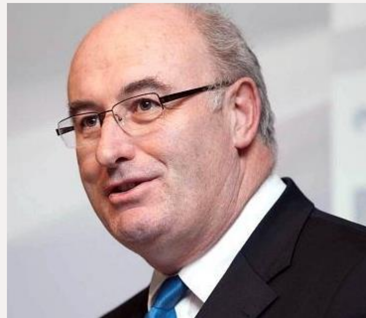
Landbrukskommissær Phil Hogan