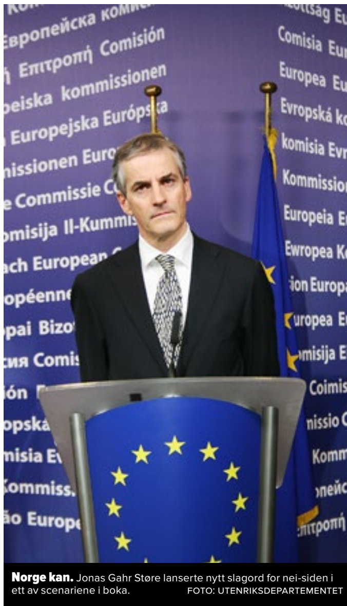
Norge kan. Jonas Gahr Støre lanserte nytt slagord for nei-siden i ett av scenariene i boka.

Det tredje scenariet heter «Some like it