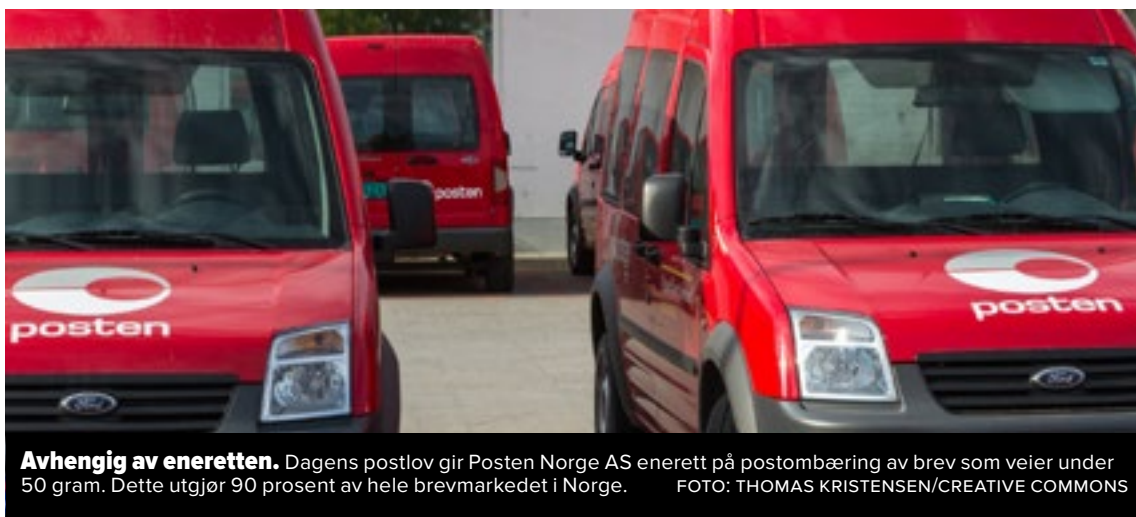
Avhengig av eneretten. Dagens postlov gir Posten Norge AS enerett på postombæring av brev som veier under 50 gram. Dette utgjør 90 prosent av hele brevmarkedet i Norge.

Regjeringen forsikrer at brev mellom hver enkelt av oss fortsatt skal koste det samme overalt. Slippes konkurransen løs, er det næringslivet utafør Oslo-gryta og en håndfull storbyer som rammes. Det blir dyrere for de distriktsbedriftene som har store mengder brev å sende. Det kan føre