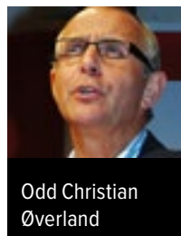
Odd Christian Øverland

– Erfaringar frå Tyskland og Nederland viser i tillegg at gode postarbeidsplassar med ordna tariff-tilhøve har vorte sterkt råka av sosial dumping etter liberalisering.