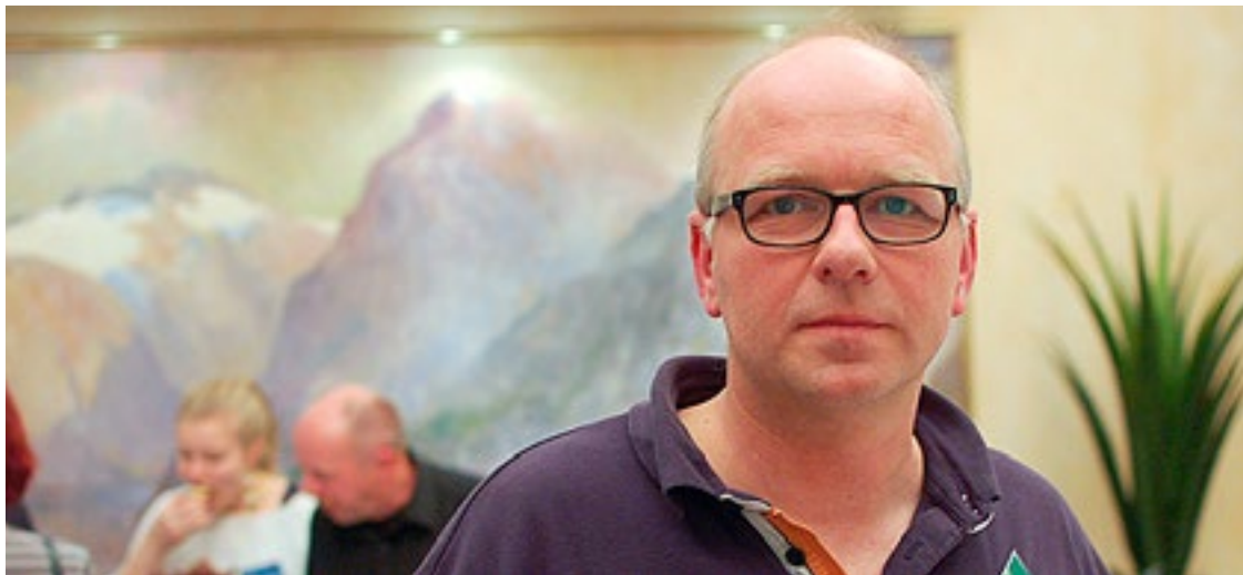
Veksande antiføderalisme. Motstanden mot den føderalistiske utviklinga i EU er aukande også i andre land, men ikkje med naudsyn av same grunn som i dei skandinaviske neirørslene.