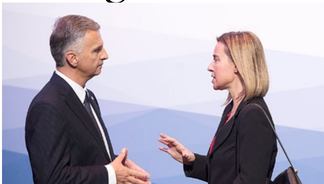
Sveits og EU. Den sveitsiske presidenten Didier Burkhalter ønsket Federica Mogherini, visepresident i EU-kommisjonen, velkommen til Basel i desember.

Strukturen i samarbeidet mellom EU og Sveits er at forholdet reguleres gjennom bilaterale, mellomfolkelige avtaler. Det vil si en form for regulering som baserer seg på partenes likestilling. EU eller EU-retten har ingen forrang eller overvekt av stemmer