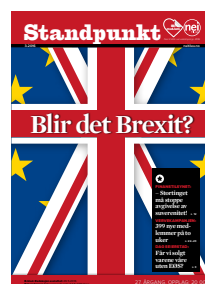
Standpunkt 3-2016, gitt ut 29. mai 2016.