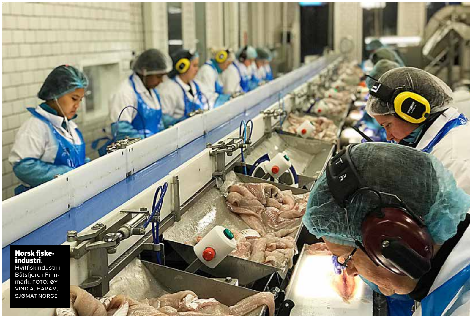
Norsk fiskeindustri. Hvitfiskeindustri i Båtsfjord i Finnmark.