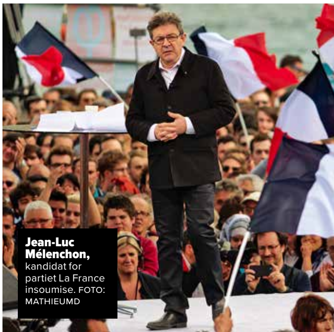
Jean-Luc Mélenchon, kandidat for partiet La France insoumise.

Jean-Luc Mélenchon, kandidat for partiet La France insoumise (dei ukuelege) ved presidentvalet i 2017, si rolle kjem tidleg til syne i boka. Han ville visa at det var mogeleg å stå imot EU sine krav og å samstundes gjera