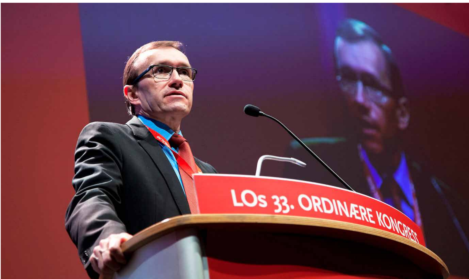
Regjeringa vil kjempe. Utanriksminister Espen Barth Eide slår fast at regjeringa prioriterer høgt å sikre at handhevingsdirektivet ikkje kjem i konflikt med dei norske tiltaka mot sosial dumping.