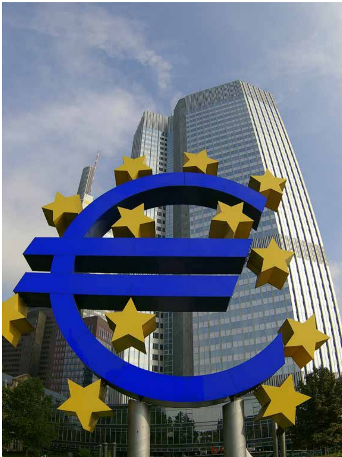
Den europeiske sentralbanken. Alt i 1971 pekte en del EF-motstandere på at dannelsen av en valutaunion ville innebære at det ble opprettet en sentralbank, at enkeltstatene ble sjaltet ut av penge- og finanspolitikken, og at betalingsbalansene mellom landene i unionen ville forsvinne.

På den andre siden har Europas fagbevegelse for første gang i sin historie gjennomført koordinerte streiker og aksjoner på tvers av landegrensene i protest mot nedskjæringspolitikken. Også FNs