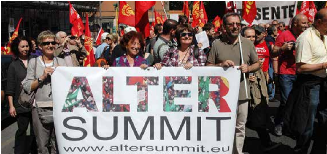
Alter Summit. Tusener krever stopp i nedskjæringspolitikken og et annet Europa. Bildet viser Alter Summit i Italia i mai.

Den 7.-9. juni møttes flere tusen representanter fra fagorganisasjoner og sosiale bevegelser fra hele Europa i Aten under paraplyen «Alter Summit» (Alternativ toppmøte).