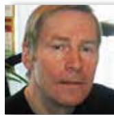
Av Ivar Hellesnes Veterinær, Trondheim