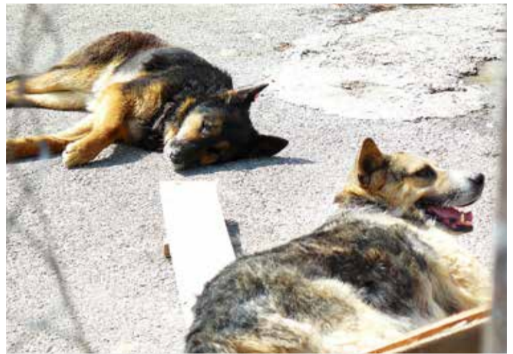
Import av smittefarlige hunder. Det er trolig importert flere tusen gatehunder fra Sør-Europa til Norge etter at EØS-regelverket ble oppmyket i 2005.

I disse dager er det et annet saksområde enn hestekjøttskandalen som må få vår oppmerksomhet når det gjelder attesters troverdighet, nemlig den store og økende innførsel