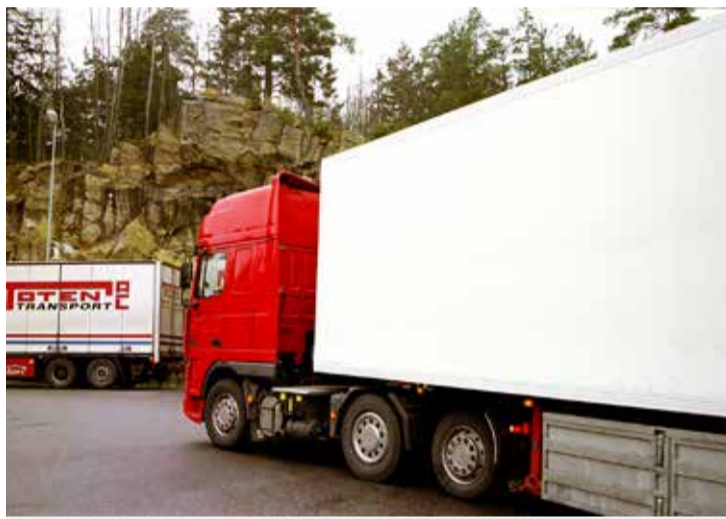
Undergraver arbeidsplasser og sikkerhet. EU-kommisjonen ønsker en liberalisering av kabotasje-reglene, som vil fjerne restriksjoner mot at utenlandske vogntog fritt kan ta oppdrag i Norge. ARKIVFOTO

EU-kommisjonen ønsker en liberalisering av kabotasje-reglene. Begrunnelsen er å stimulere til økt konkurranse mellom de ulike landenes transportører, som kommisjonen mener vil bidra til økonomisk vekst. Både i EU-parlamentet og