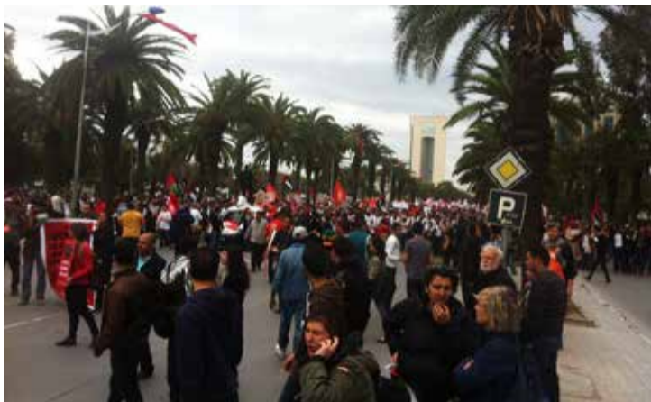
50 000 i demonstrasjon. Verdens Sosiale Forum i Tunisia ble innledet med en stor demonstrasjon med budskapet «En annen verden er mulig».

Fisken er helt avgjørende for at lokalbefolkningen kan leve og ernære seg. Også de afrikanske landene er rammet av økonomisk krise, og fisken er strategisk viktig for matvaresikkerheten i disse land, ikke minst