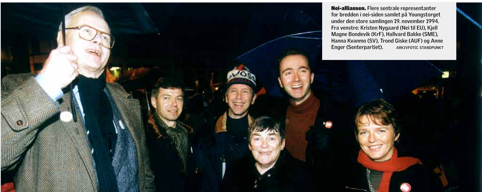
Nei-alliansen. Flere sentrale representanter for bredden i nei-siden samlet på Youngstorget under den store samlingen 19. november 1994. Fra venstre: Kristen Nygaard (Nei til EU), Kjell Magne Bondevik (KrF), Hallvard Bakke (SME), Hanna Kvanmo (SV), Trond Giske (AUF) og Anne Enger (Senterpartiet).

«Skammens mur» hadde i årtier vært en påminnelse om Den kalde krigen, og ble på