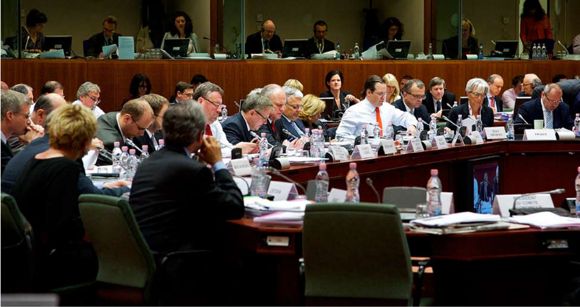
Ecofin. EUs 27 finans- og økonomiministre møtes i det såkalte Ecofin-rådet. 17. mai møttes finansministrene for å vedta blant annet krisepakken til Portugal.