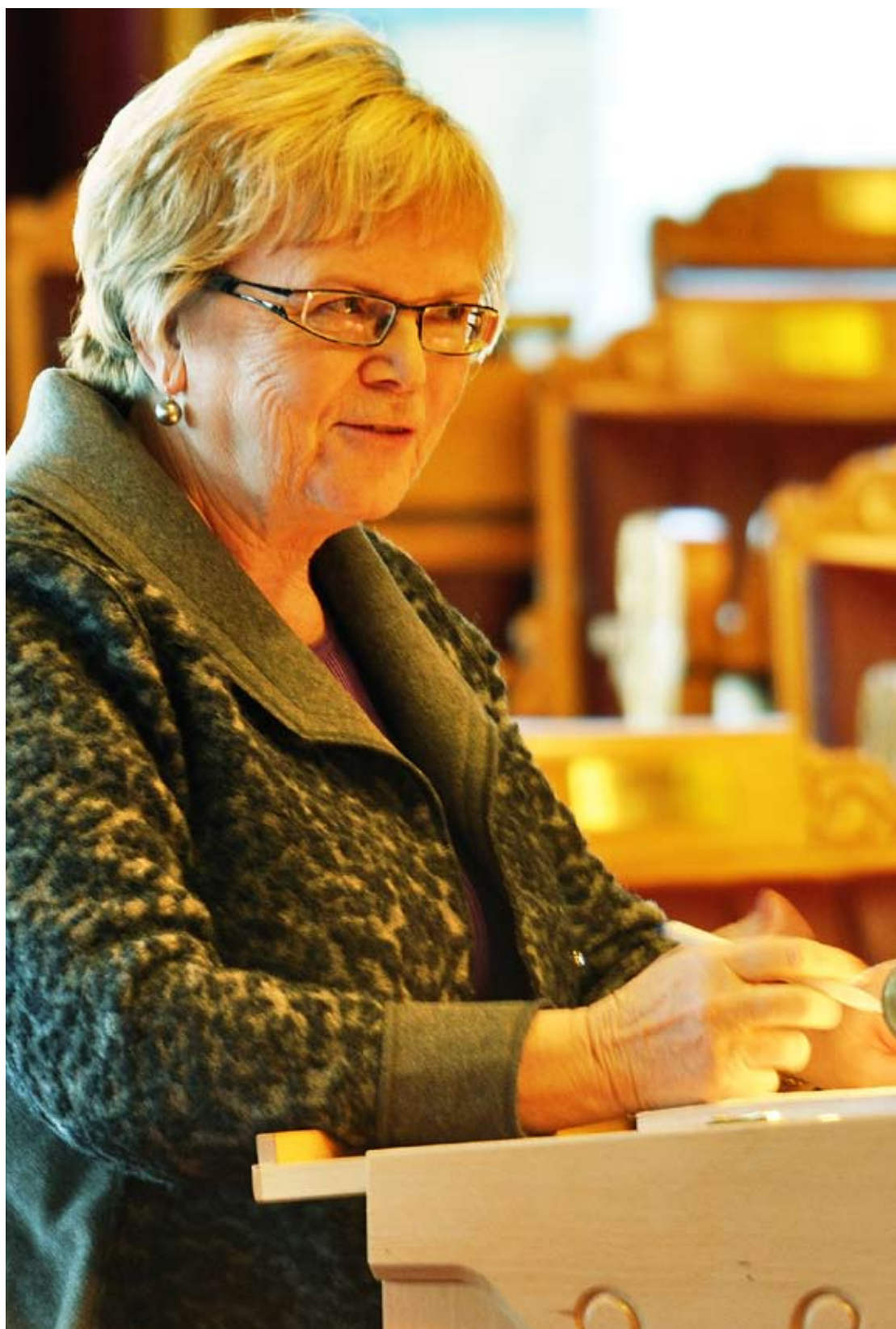
Stoler på Støre. – Jeg har ingen grunn til å tro at han verken legger egne definisjoner inn i denne saken, eller trenerer, sier samferdselsminister Magnhild Meltveit Kleppa om Jonas Gahr Støres forhandlinger med EU om postvetoet.

– Jeg synes det er illevarslede når Dagens Næringsliv påpeker at EU var klare til å igangsette Artikkel 102-prosessen fra 1. juli, men ble hindret av Støre. Trenering og tåkelegging er kjente strategier i politikken når noen vil at noe ikke skal skje. Det