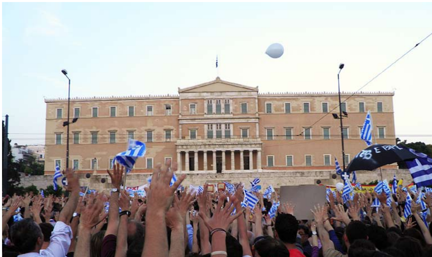
Sinte grekarar demonstrerer. Hellas må gjennomføre store budsjettkutt for å motta redningspakker frå EU. Resultatet kan verte stor offentlig og privat fattigdom. I mai demonstrerte sinte grekarar framfor parlamentet mot regjeringa sine dramatiske kutt i velferden.

Redningspakkene har ført eurosona inn ein felles finanspolitikk, ein fiskalunion. Ein fiskalunion vil føre til ein ny politisk økonomi, til skilnad frå den opphavlege som skulle verne ESB frå politisk trykk. Ei slik finansregjering vil vedta penge-, finans-, løns-, og sosialpolitikken til medlemslanda på ein vilkårleg måte. Verktøya vil vere sanksjonar og nedrivning av dagens standard, der