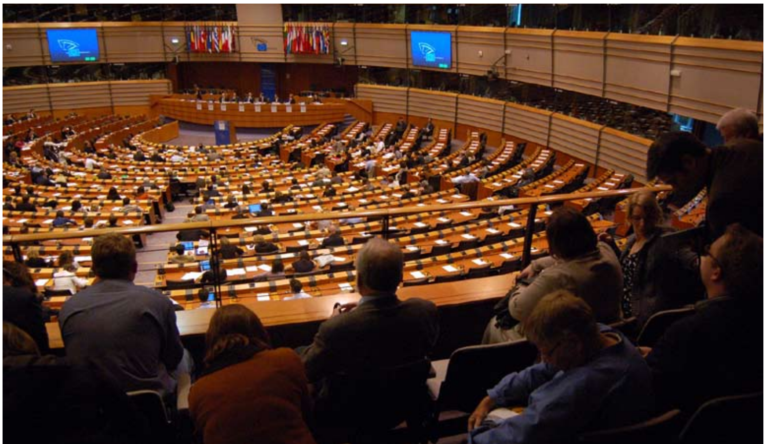
I EU-parlamentet. Delegasjonen fra Nei til EU observerer debatten i EU-parlamentet. Tidligere EU-kommisjonspresident Romano Prodi var invitert for å tale om utfordringene for landbruket og matproduksjon. Talen ble oversatt på direkten til de andre offisielle språkene i EU.

fylkeskommuner og støttes økonomisk av blant annet Råfisklaget.