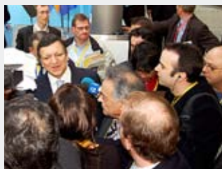
Kommisjonspresident Jose Manuel Barroso får hjelp av ein informasjonsstab på 1000 personar, før han skal møte pressa.