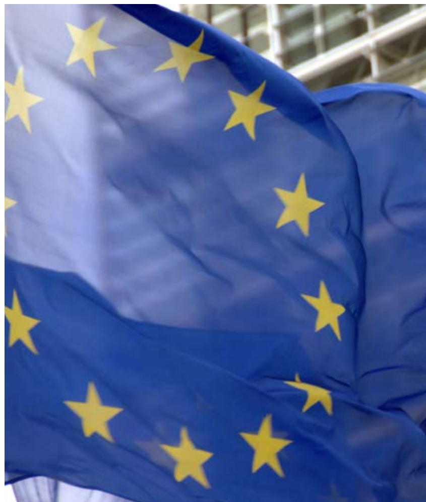
Demokratisk underskudd. Et omfattende forskningsprosjekt viser at EU ikke har offentlig sfære er EU ute av stand til a vare demokratisk.

Av Morten Harper morten.harper@neitileu.no