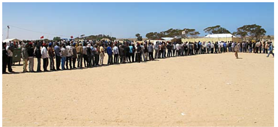
Libyske flyktningar. Flyktningar frå Tunisia og Libya skaper krise mellom Italia og andre EU-land. Men berre 30 000 av 750 000 som er på flukt har kome seg til Europa. Biletet viser flyktningleiren Shousha ved grensa til Libya i Tunisia.

Utfordringane står i kø for EU for tida. Sist ut er misnøye med Schengen-avtalen, og høglydd diskusjon i fleire land om å gjeninnføre grensekontroll. Mest dramatisk er situasjonen ved Middelhavet.