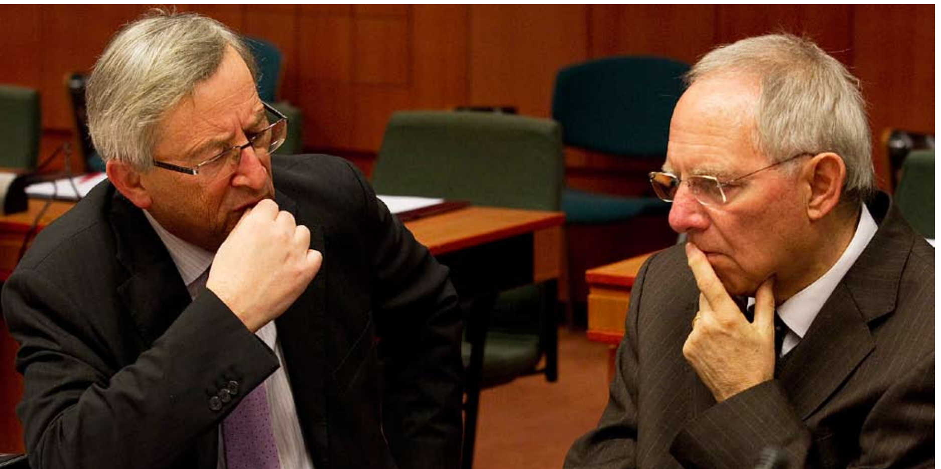
Åtvarar mot konkurs. Wolfgang Schäuble (t.h.)m finansminister i Tyskland, meiner det er reell risiko for at Hellas går konkurs. Her diskuterer han euro-krisa med formannen i eurogruppa, Jean-Claude Juncker (t.v.), statsminister i Luxembourg.