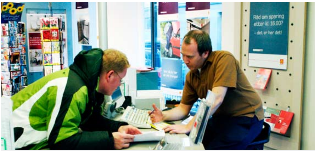
Postkonkurranse. Postkom tror postdirektivet vil bli diskutert også internt i EU. Utbredelsen av digital kommunikasjon sprer seg langt ut på landsbygdene også i EU, noe som vil gjøre det enda vanskeligere å innføre konkurranse på levering av brevpost.