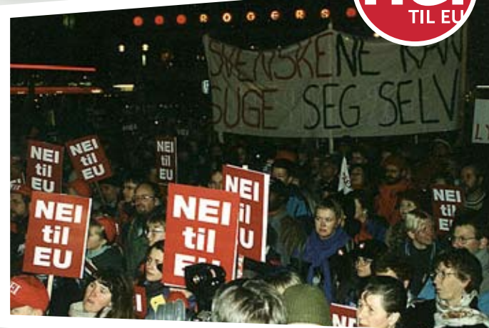
Nei-demonstrasjon i 1994. Bildekomiteen til historiebokprosjektet vil gjerne ha bilder fra «Aksjon frammøte» i 1994.