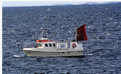
75 år i år. Norges Råfisklag jubilerer.