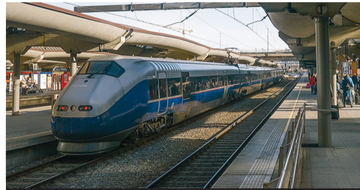
Valget kan avgjøre. EUs helikopterforordning vil svekke sikkerheten i offshore-transporten dramatisk. Bare Arbeiderpartiet og Rødt har programfestet at de vil stoppe forordningen. Et regjeringsskifte kan åpne for veto mot EUs jernbanepakke IV