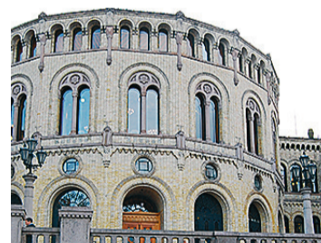
Overlater makt til EU. Stortinget må ta stilling til nye EØS-saker i kommende periode.

met en rekke direktiv som aldri ville blitt foreslått av en norsk regjering. Et resultat av den pågående EØS-debatten er at flere partier åpner for mer aktiv bruk av reservasjonsretten.