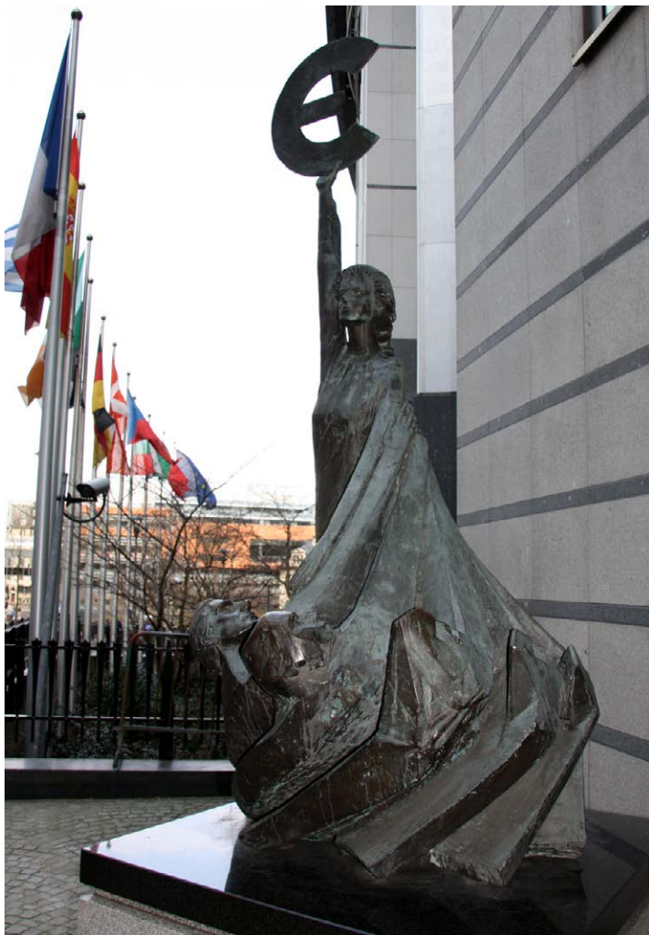
Brussel: Foran EU-parlamentets bygning i Brussel står en statue kalt Europa.

Nye lover må normalt vedtas av både EU-parlamentet og ministrene i rådet. Parlamentet ikke formell myndighet over skatter og sosialpolitiske saker. Det samme gjelder utenriks- og sikkerhetspolitikk. Parlamentet har ikke adgang til å fremme lovforslag. Det er det i henhold til den alminnelige beslutningsprosedyren bare EU-kommisjonen som kan gjøre. I økende grad har dessuten kommisjonen fått delegert myndighet til selv å vedta nye forordninger, for eksempel på energiområdet.