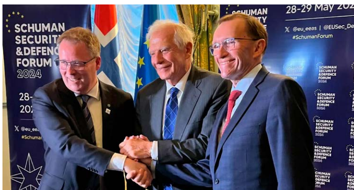
Ny avtale: Forsvarsminister Bjørn Arild Gram, EUs utenrikssjef Josep Borrell og utenriksminister Espen Barth Eide ved signeringen av forsvarsavtalen mellom Norge og EU 28. mai 2024.

realiteten begrenser Norges suverenitet, særlig i lys av at EU stadig tar nye steg for en overnasjonal militærunion. Norge ble tilsluttet EUs forsvarsfond ved at fondet ble innlemmet i EØS-avtalen. Det var imidlertid en forutsetning for EØS-avtalen at forsvarspolitikken skulle holdes utenom, og det bør være uaktuelt å legge samarbeidsavtaler om forsvar inn i EØS.