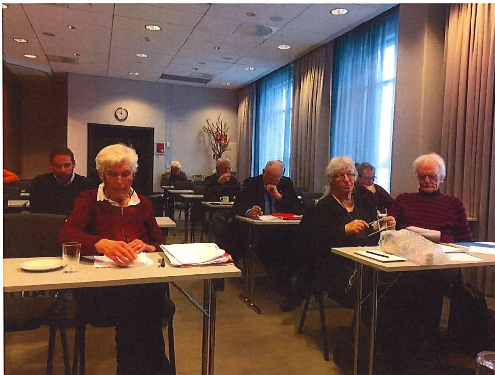
Fra Fylkesårsmøte i Hedmark NEI til EU i2018.

Det meste av arbeidet i Hedmark Nei til EU er knyttet til fylkesstyret og fylkesstyremøtene. Denne årsmeldingen tar for seg arbeidet i fylkeslaget i 2018. I perioden har fylkeslaget jobbet i tråd med Nei til EUs sentrale arbeidsplaner og egen arbeidsplan. Arbeidet med å informere om ACER, EUs energibyrå fortsatte aktivt i vinterhalvåret i 2018.