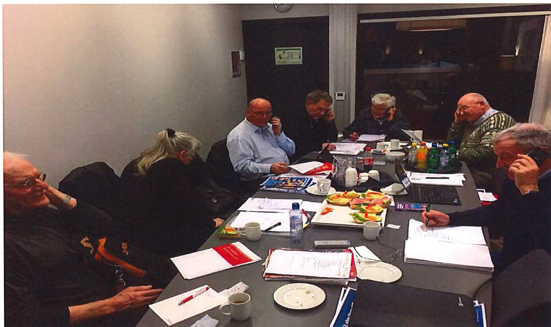
Bilde: Styret verver medlemmer under et møte.

Fylkesstyret har som tidligere arbeidet med gjenverving ved å ringe medlemmer som ikke har betalt. Fra de eldste medlemmene i Hedmark får vi ofte svaret nei takk til fornyelse av medlemskapet sitt. Grunnen kan være både økonomisk og/eller helsemessig. Nyverving har de fleste i styret drevet ved ringing eller ved å kontakte personer på stands eller markeder.