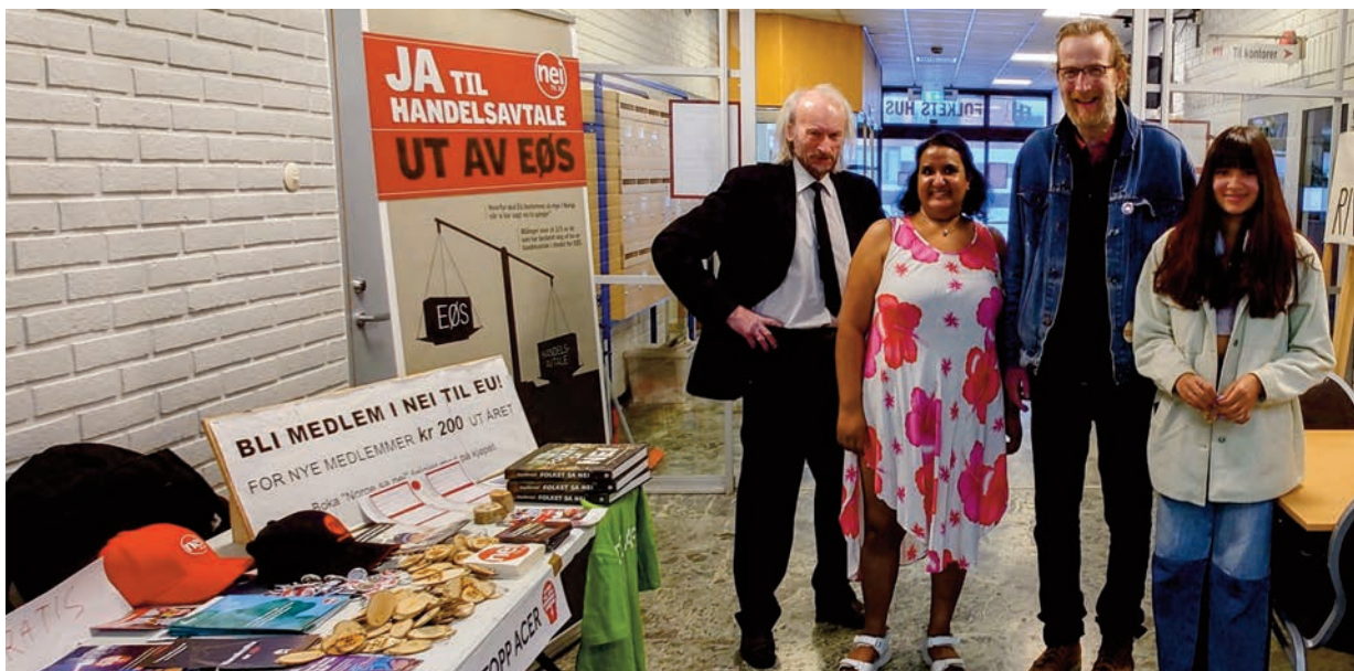
Bilde frå 1. mai-feiringa i Stavanger: stand på Folkets Hus og 1. mai-toget.