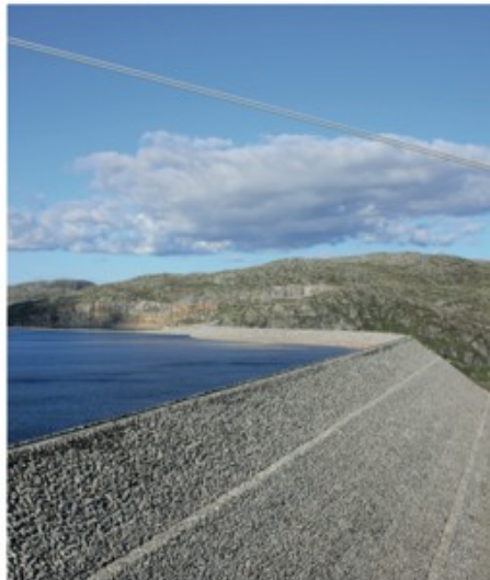
Storvassdammen, Rykle kommune.

I dag har Norge nærmere 75 prosent fornybar energi, i hovedsak vannkraft. Målet for EU-landene er at de skal ha 42,5 prosent fornybar energi innen 2030. EU vil at Norge skal bygge ut enormt mye ny fornybar kraft som skal gå til EU-land. Hvis Norge godtar fornybardirektivet, vil Norge være medansvarlig for at hele EU når sitt unionsmål, og bygge ut fort. Dette vil gå ut over kraftforedlende industri, øke de historisk høye strømprisene enda mer for folk flest og ødelegge enda mer natur.