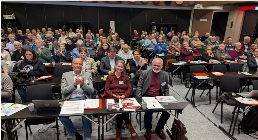
Landsmøtet samla til drøftinger på Hamar 08. til 10. November 2024