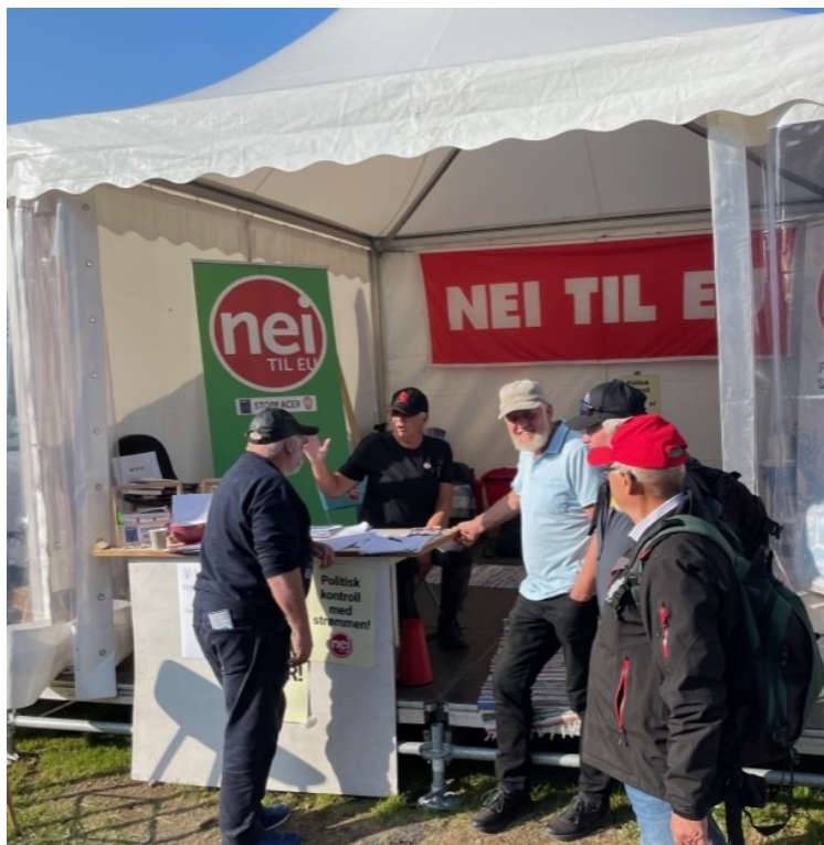
Heftig ordskifte ved standen