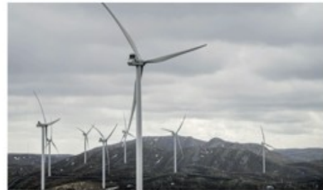
Roa vindkraftanlegg.