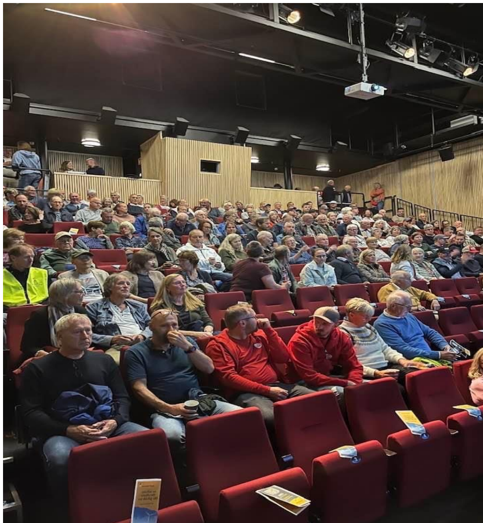
Folkemøtet i Drangedal 20. august

Telemark Nei til EU deltok i ordskiftet i møtet og delte ut 80 løpesedler til dei omlag 200 deltakarane som var på møtet.